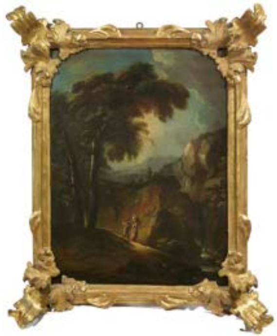
71 Scuola veneta, sec. XVIII PAESAGGI FLUVIALI CON FIGURE E TORRIONE coppia di dipinti, olio su tela, cm 74x56,5 (2)