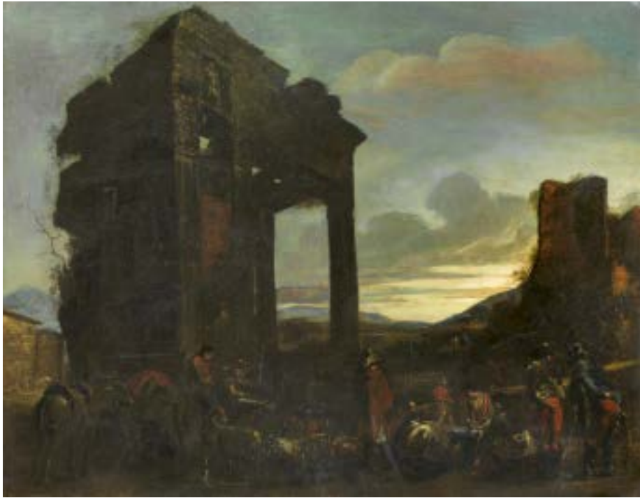
51 Cerchia di Leonard Bramer, sec. XVII